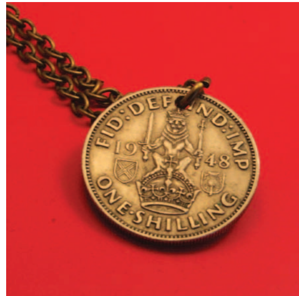
Британский шиллинг времен короля Георга VI

Спенсли приводит в качестве примера сцену с шиллингом, который Георг дает Логу в оплату его услуг. Шиллинг имеет