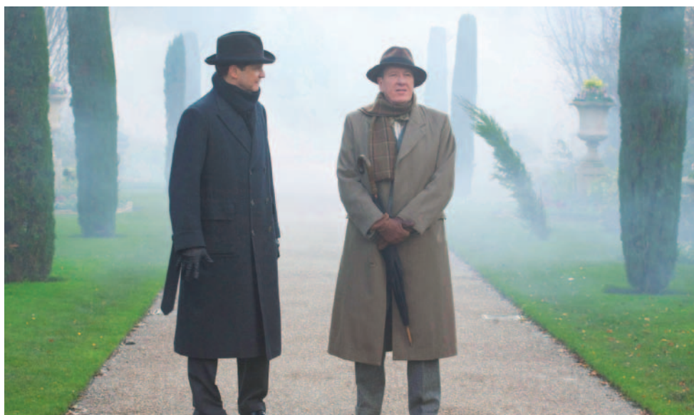
Сцена в парке

Львиная часть работы над визуальными эффектами в фильме состояла в удалении из кадра современных зданий