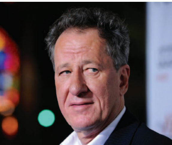
Блистательный Джеффри Рауш

Студия Molinare выступила сопродюсером фильма и обеспечила практически все услуги по обработке изображения. Сюда входят: прием команды монтажеров, создание визуальных эффектов, выполнение цветоустановки DI и окончательный монтаж, а также печать мастер-копии на 35-мм киноплёнку и тиражирование всех цифровых прокатных копий, включая те, что предназначались для проката в цифровых кинотеатрах.