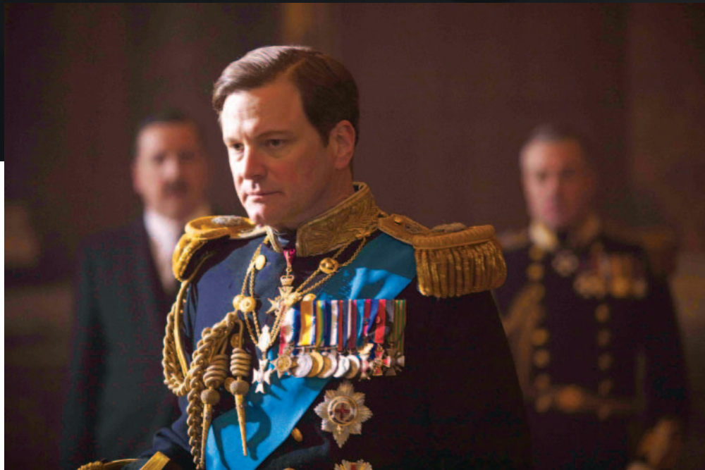
Колин Ферт в роли короля Георга VI

Фильм «Король говорит» рассказывает историю об удивительном восхождении Георга VI (его роль сыграл Колин Ферт, обладатель Oscar за лучшую мужскую роль) на английский трон и его мужественную попытку преодолеть острую проблему заикания. Происходивший в то же самое время взлет Гитлера в Германии идет как бы фоном повествования, и вызывает чувство беспокойства среди граждан Британии, к которому и апеллирует Георг в важном